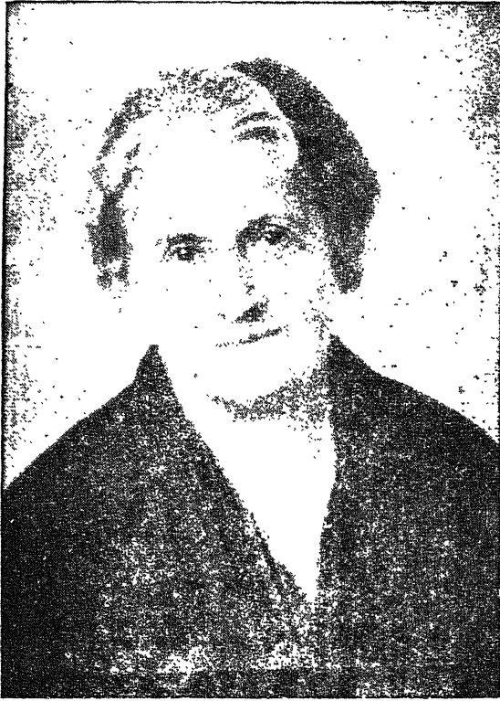
मेरिया मॉन्टेसरी ( १८७०-१९५२ )